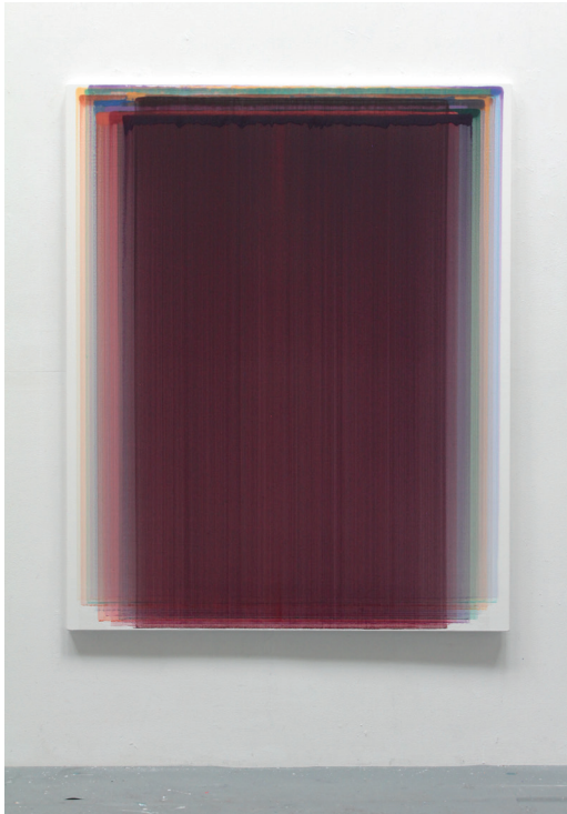
Layer Colors Painting 100-25, 2019, Acrylic on canvas, 160 x 130 cm

If Vincent van Gogh's light is the brightness of midsummer's high noon, then my light is the dawn sky touching the earth, the glow near the sun at the break of day, the transparent light of a young girl's short middle fingernail. Light and color are fundamental elements of painting, but in my work, they become absolute elements in conjunction with semi-transparent media.