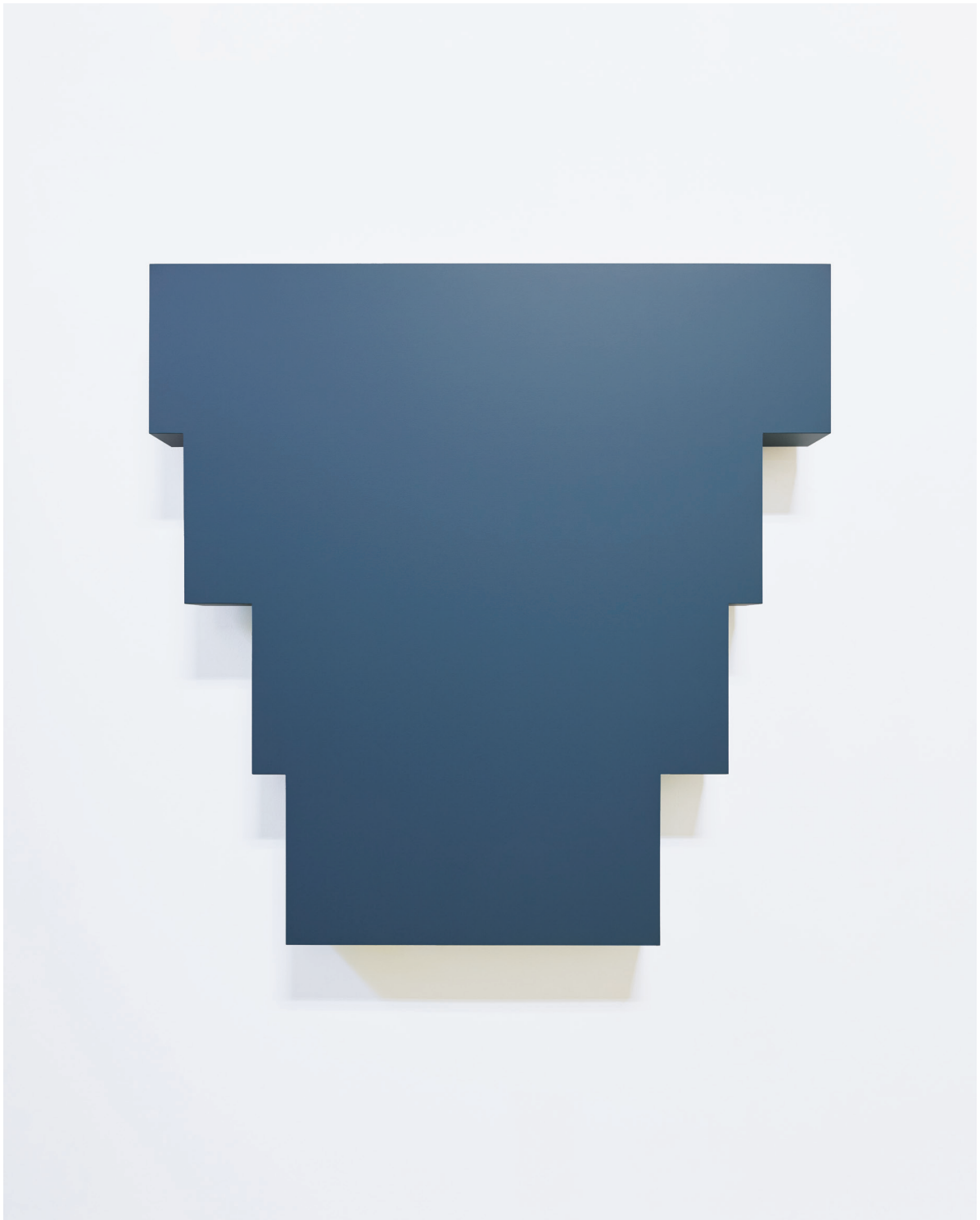
François Perrodin, "97.5", 2026, acrylic paint on wood, 120 x 120 x 9 cm